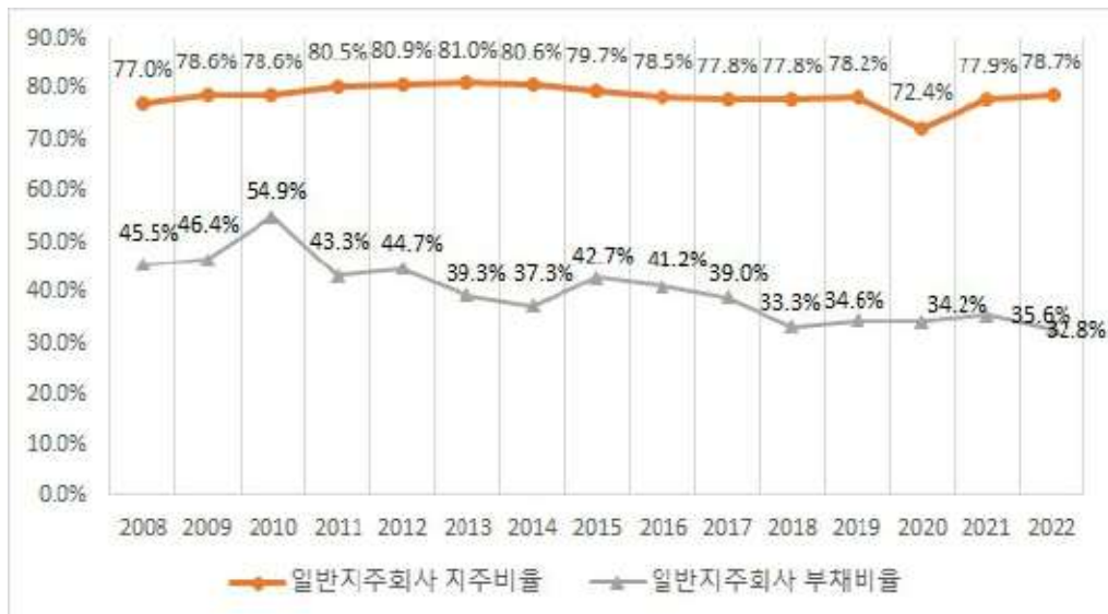
일반지주회사수 지주비율 및 부채비율(2021년 12월 기준)