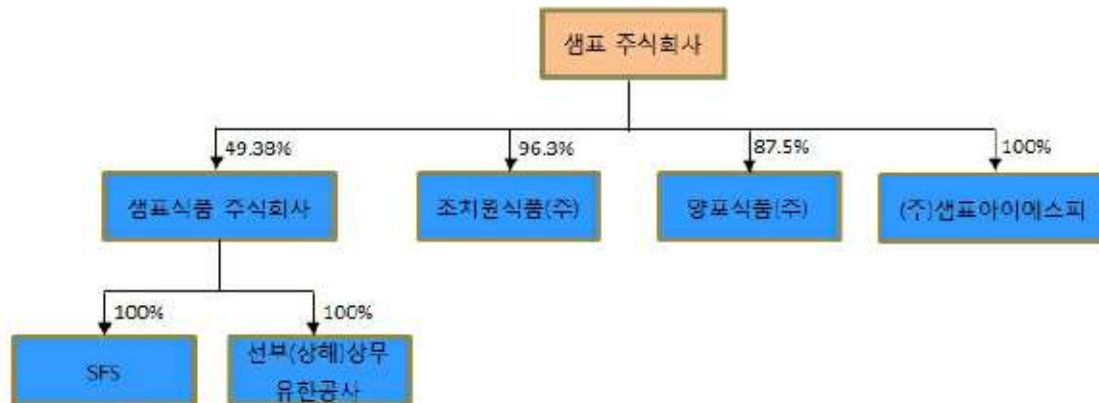
계열회사 및 연결대상종속회사의 계통도(2022년 12월 31일 기준)